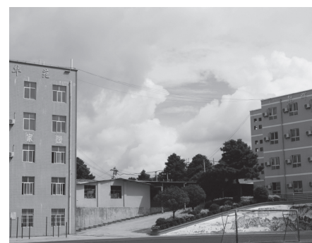
改造前的学校。