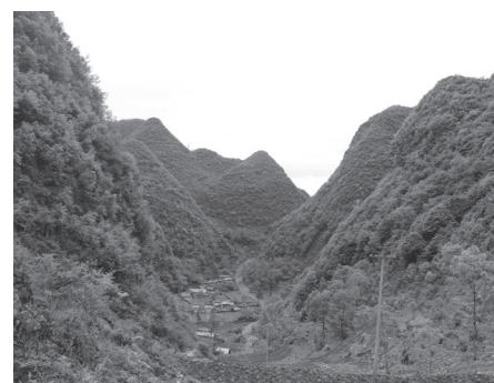
易地搬迁前部分群众深居大山。