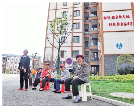
易地搬迁后新社区群众的笑容。