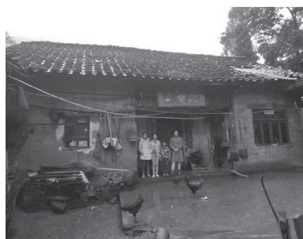
易地搬迁前部分群众居住的旧房。