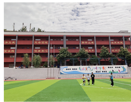
改造后的学校。