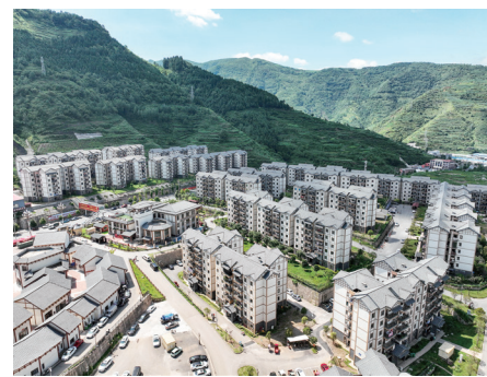
易地搬迁后的社区新风貌。