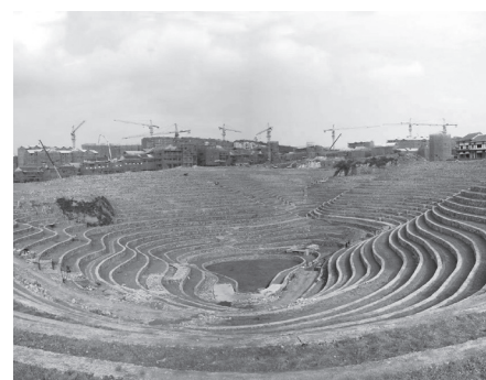
建设中的易地扶贫搬迁安置区。