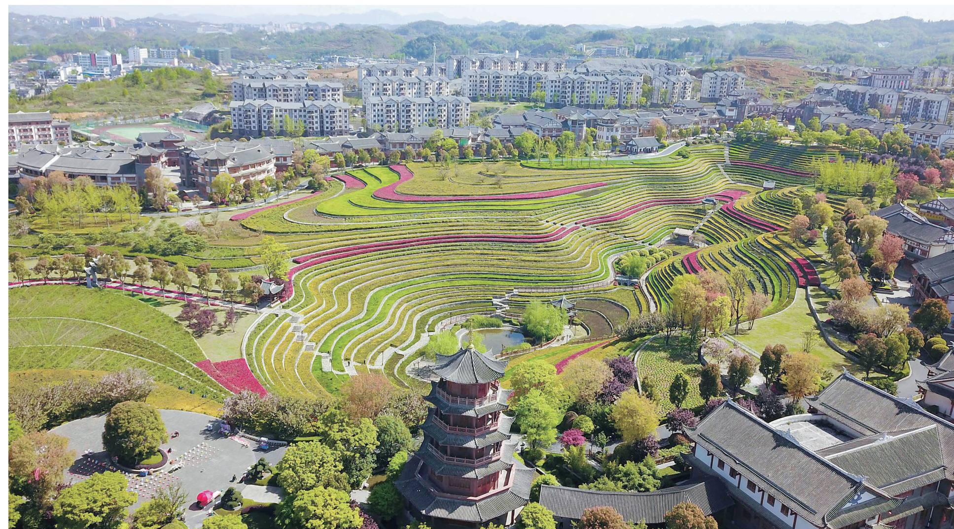
2022年4月7日,贵州省毕节市大方县奢香古镇,城市梯田景色美丽。时下,贵州省毕节市大方县奢香古镇城市梯田景区春和景明,生机盎然的梯田层层叠叠,线条分明,景色美丽。