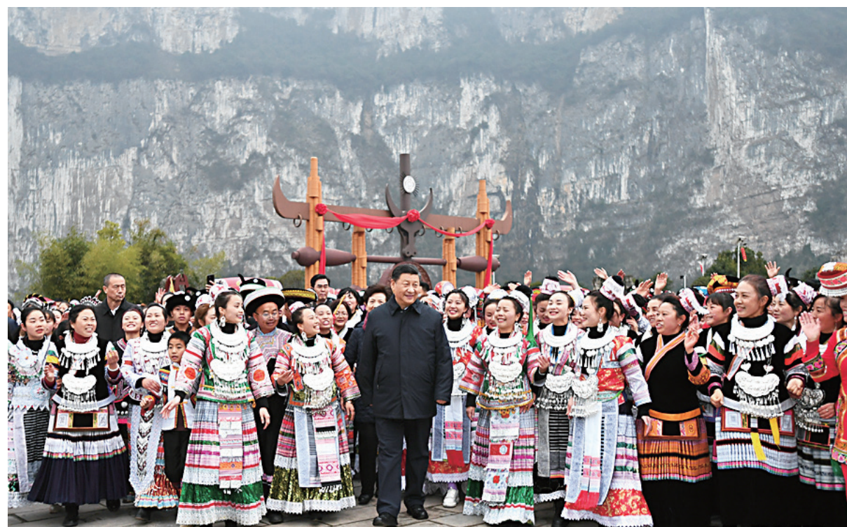
2021年2月3日至5日,中共中央总书记、国家主席、中央军委主席习近平来到贵州考察调研,看望慰问各族干部群众,向全国各族人民致以美好的新春祝福。这是3日下午,习近平在毕节市黔西县新仁苗族乡化屋村考察结束时,乡亲们依依不舍簇拥着总书记,齐唱苗家留客歌。

2021年2月3日,习近平总书记来到贵州考察调研,为新时代毕节实现高质量发展指明了前进方向、提供了根本遵循、注入了强大动力。