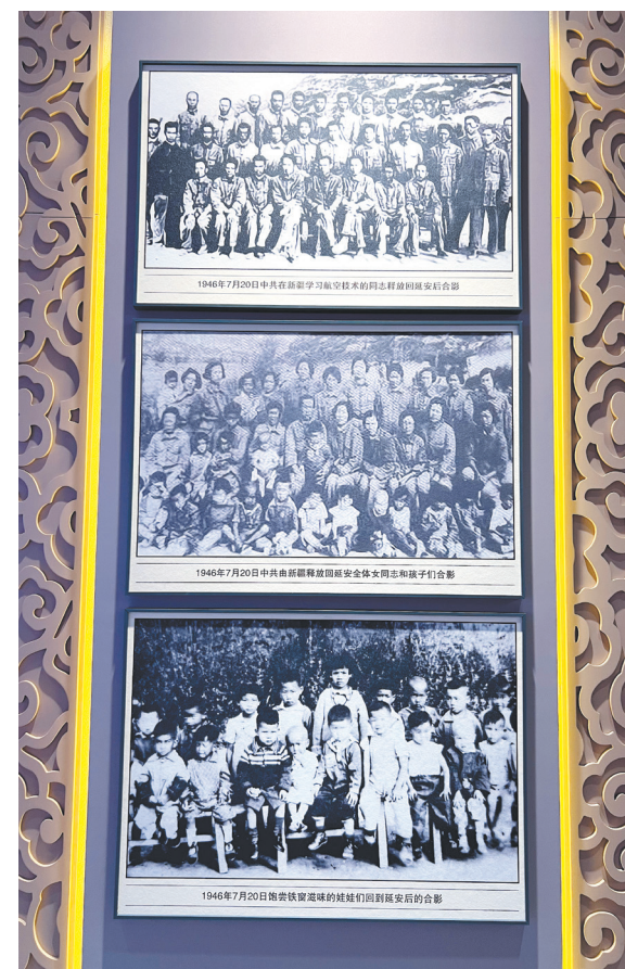
▲“红星耀天山——中国共产党领导新疆革命文物故事展”相关照片资料。