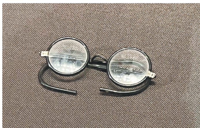
▲俞秀松在新疆工作期间戴过的眼镜。