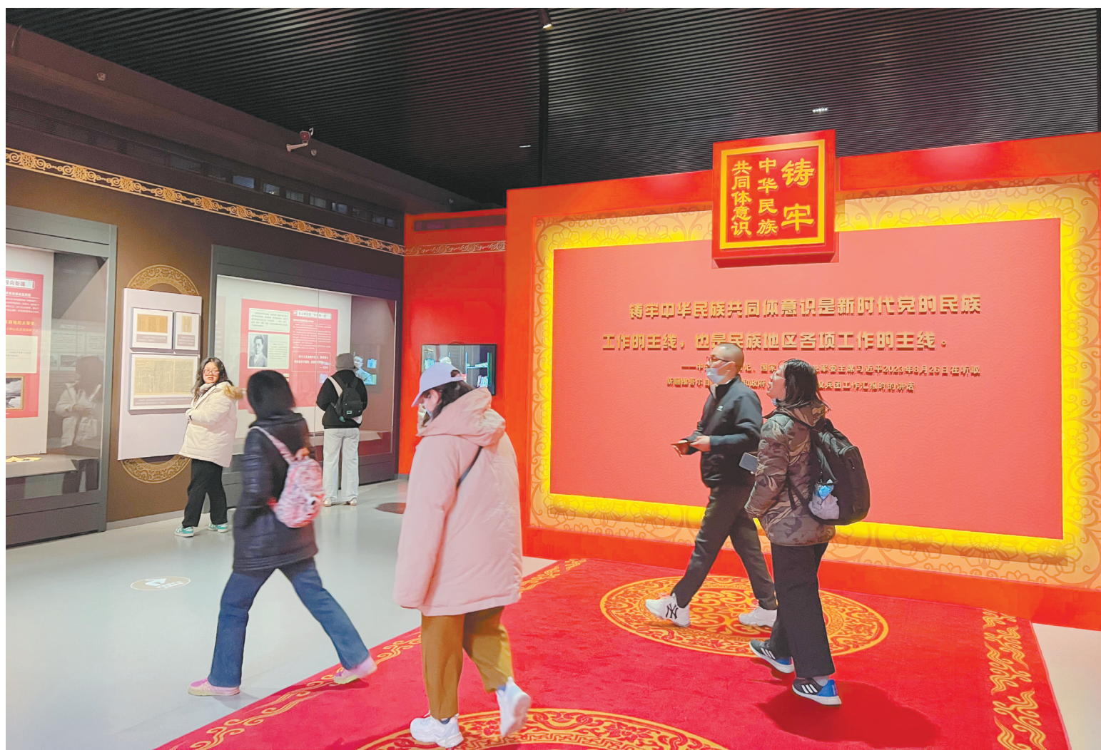
▲民众在北京民族文化宫二楼参观“红星耀天山——中国共产党领导新疆革命文物故事展”。