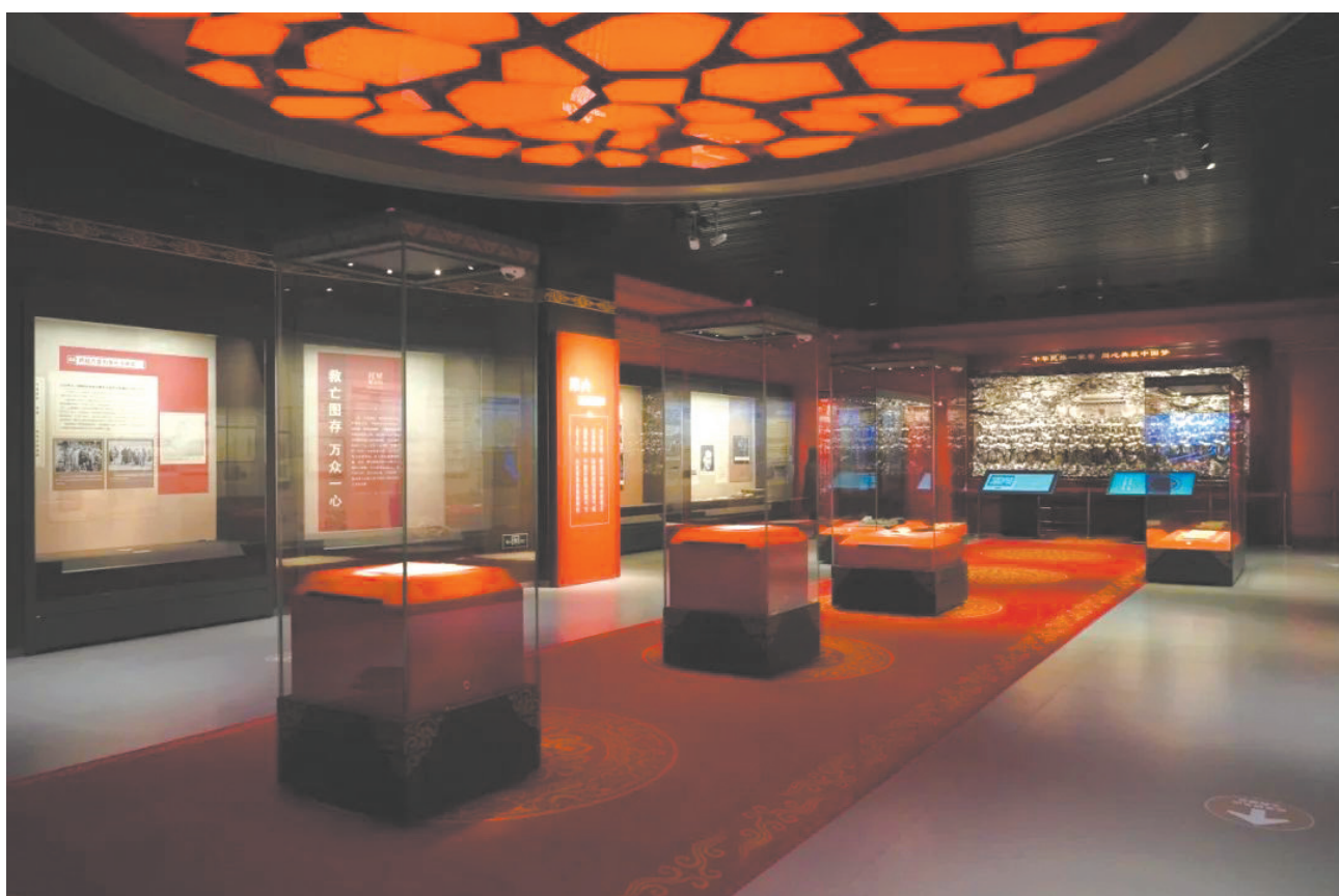
▶展览现场。“民族文化宫”微信号