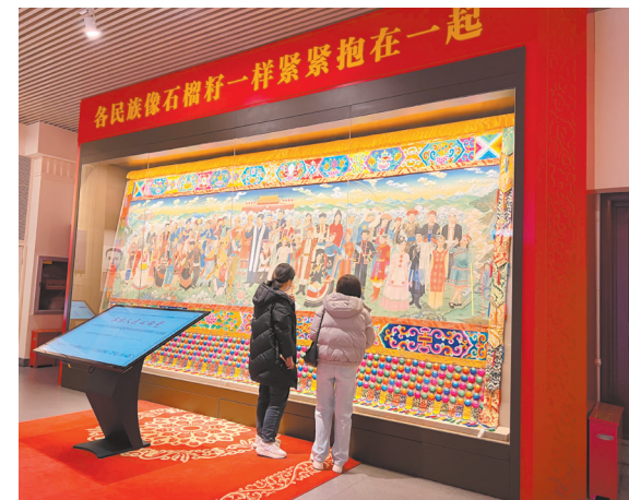
▲《民族团结一家亲》运用了世界级非物质文化遗产——黄南热贡唐卡艺术,整个作品在热贡艺术发祥地青海省同仁县历经2年绘制创作完成。图为现场人士参观唐卡《民族团结一家亲》。