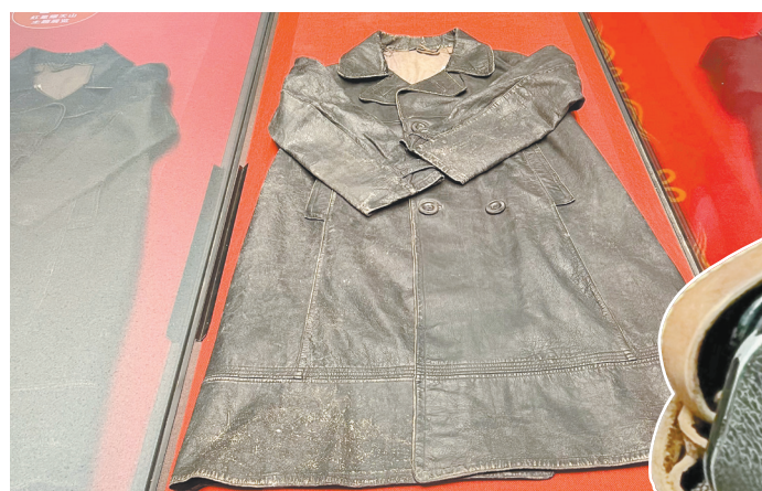
▲陈潭秋在新疆工作期间穿过的皮大衣。