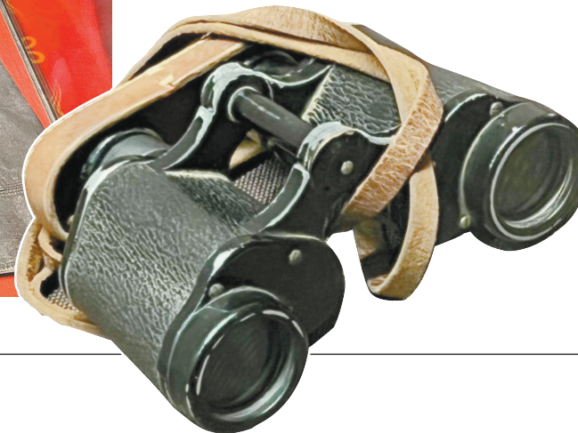
▼“新兵营”指战员使用过的军用望远镜。