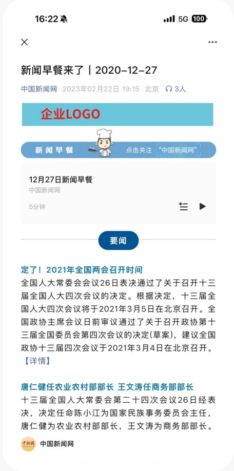
中国新闻社 官方微信 首页