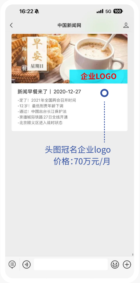
中国新闻网 官方微信 新闻早餐