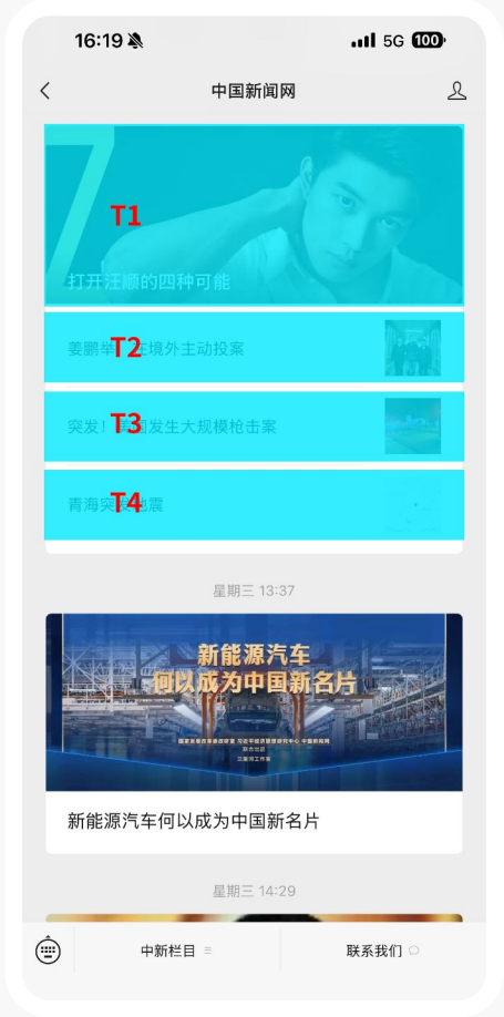
中国新闻网 官方微信 首页